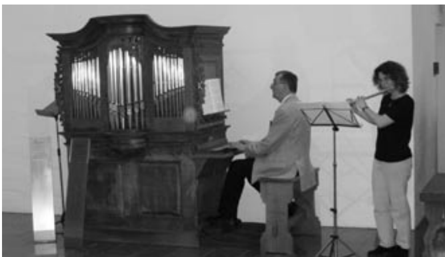
Kurzkonzert mit Orgel und Flöte

Als Termin für die Mitgliederversammlung 2007 wurde der 2. Juni 2007 festgelegt. Der Ort für die Versammlung wird in der Einladung bekannt gegeben. Damit ergeht die Bitte, bei Planungen im Diözesanverband diesen Termin