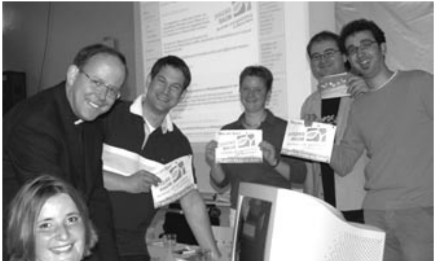
Die Stiftung „JugendRaum“ wird vorgestellt

Ein wichtiges Thema der jährlichen Versammlung war das Eintreten gegen aufkommende rechtsextreme Einstellungen und deren Ausbreitung unter Jugendlichen. Die Delegierten aus den Jugendverbänden und Dekanaten beschlossen, dem Netzwerk „Demokratie und Courage“ in Hessen und Rheinland-Pfalz beizutreten.