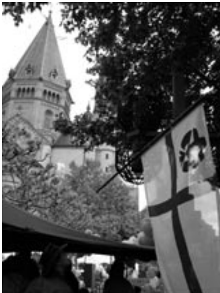
Das DPSG-Banner weht im Schatten des Doms

Dieses Geschenk musste der Kardinal sofort ausprobieren: Die DPSG schenkte Bischof Karl Lehmann zu seinem 70. Geburtstag einen Pfadfinderhut - stilecht natürlich in Kardinalsrot. Und Lehmann bewies, dass das Pfadfinder-Accessoire perfekt zu ihm passte. Gut gelaunt flanierete er mit dem in Bolivien hergestellten Pfadfinderhut Richtung Jurte.