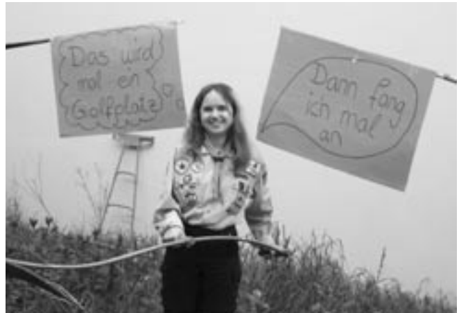
Stamm St. Johannes der Täufer, Weiterstadt: „...mache ich nichts halb und gebe auch in Schwierigkeiten nicht auf.“