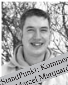
VorStandPunkt: Kommentar von Marcel Marquardt

In der neuen Ordnung der DPSG steht auf Seite 18 oben, direkt über dem Pfadfindergesetz: Das Gesetz der Pfadfinderinnen und Pfadfinder beschreibt Regeln, an die sich alle Mitglieder des Verbandes aus eigener Überzeugung halten. Eine wichtige Idee und eine schöne Formulierung, aber verpflichtet tut sich keiner, weil es schwarz auf weiß in der Ordnung steht. Schon gar nicht selbst verpflichten. Einige der Gesetze sind schwierig auszuhalten, andere sind nicht leicht einzuhalten. Und dann gibt es Gesetze, die Dinge voraussetzen, die vielleicht gar nicht der Fall sind. Wie soll man sich da ernsthaft selbst verpflichten? Kann man denn im Umgang mit den Gesetzen wahrhaftig sein und sich gleichzeitig in der Selbstverpflichtung ernst nehmen? Ich denke, es geht dann, wenn man den Gesetzen mit einem „vielleicht ja, vielleicht aber auch nein“ begegnet; wohl meinent kein gleichgültiges „vielleicht“, sondern ein bedachtes.