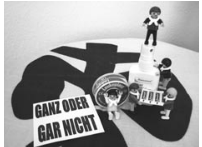
Stamm Langen: „...mache ich nichts halb und gebe auch in Schwierigkeiten nicht auf.“

Den Bürstädter Wölflingen ist das Leben in und mit der Natur sehr wichtig. Und wenn die Weidenzweige des selbst gebauten Tipis erst einmal grün werden, finden sie in einem lebenden Gebäude Unterschlupf. Somit entwickelt sich ein Bewusstsein für das Wunderbare der Natur.