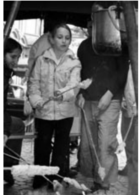
Begeistert den Nachwuchs: Lagerfeuer und Stockbrot