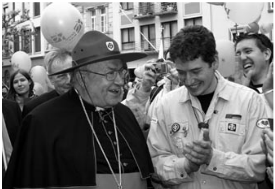
Kardinal mit Pfadfinderhut: Das DPSG-Geschenk steht Lehmann außerordentlich gut