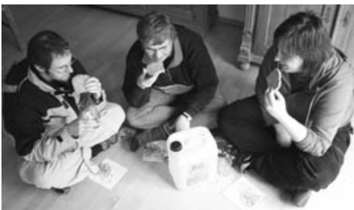
Arbeitskreis Wölflingsstufe: „...lebe ich einfach und umweltbewusst“

Bisher war der Wö-AK für seine opulenten Koch-Orgien bei den AK-Treffen bekannt. Ist mit dem neuen Gestz damit jetzt Schluss? Schließlich lebe ich als PfadfinderIn EINFACH und umweltbewusst. Unser Bild zeigt einen nicht ganz so ernst gemeinten Blick auf das künftige gemeinsame Mahl.