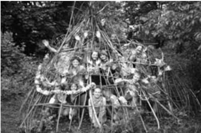
Stamm Bruder Feuer, Bürstadt: „...lebe ich einfach und umweltbewusst“

Den Bürstädter Wölflingen ist das Leben in und mit der Natur sehr wichtig. Und wenn die Weidenzweige des selbst gebauten Tipis erst einmal grün werden, finden sie in einem lebenden Gebäude Unterschlupf. Somit entwickelt sich ein Bewusstsein für das Wunderbare der Natur.