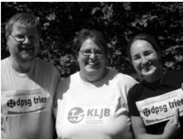
Hauptamtliche im Diözesanbüro „...stehe ich zu meiner Herkunft und zu meinem Glauben.“

Ganz oder gar nicht – so lautet eines der Mottos für uns als Pfadfinder, d.h. wenn etwas angefangen wird, dann machen wir es auch fertig. Nicht immer fällt uns das leicht – mal geht es hoch hinaus, mal aber auch im freien Fall nach unten – aber wir lassen uns dadurch nicht unterkriegen, denn nur so bleibt das Leben spannend und abenteuerreich.