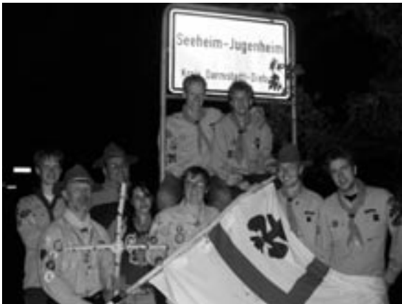
Stamm „St. Bonifatius“ Seeheim: „...stehe ich zu meiner Herkunft und zu meinem Glauben.“

Ideen aus Stämmen, Wö-AKs und dem Diözesanbüro